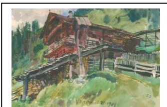
Rennlahnerhof Urkundlich erwähnt 1433